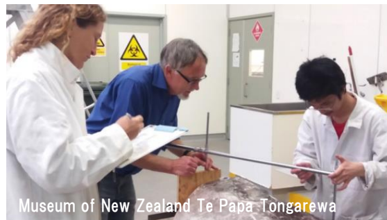
Museum of New Zealand Te Papa Tongarewa