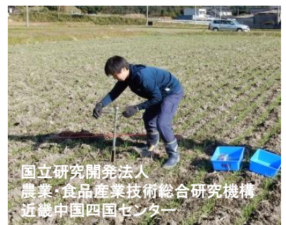
国立研究開発法人 農業・食品産業技術総合研究機構 近畿中国四国センター